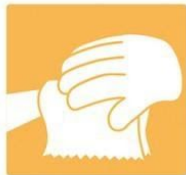
6. Закрити кран за допомогою серветки