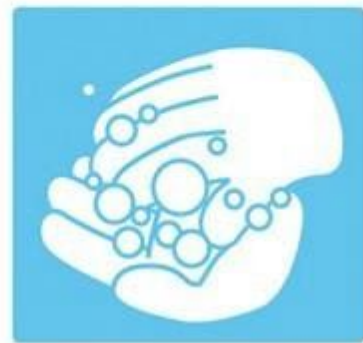
3. Мити 20 сек.